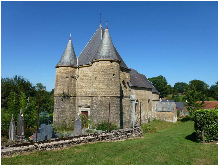
Eglise fortifiée de Servion – Rouvroy Sur Audry

Ci-après les photos des sites concernés.