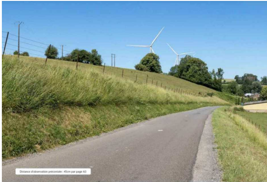
Voies de la Terre aux Lievres (08) 2e demande d'Autorisation Environnementale