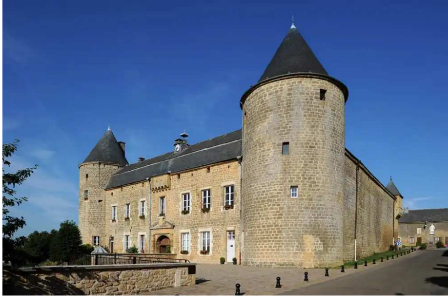
Château de L'Echelle.